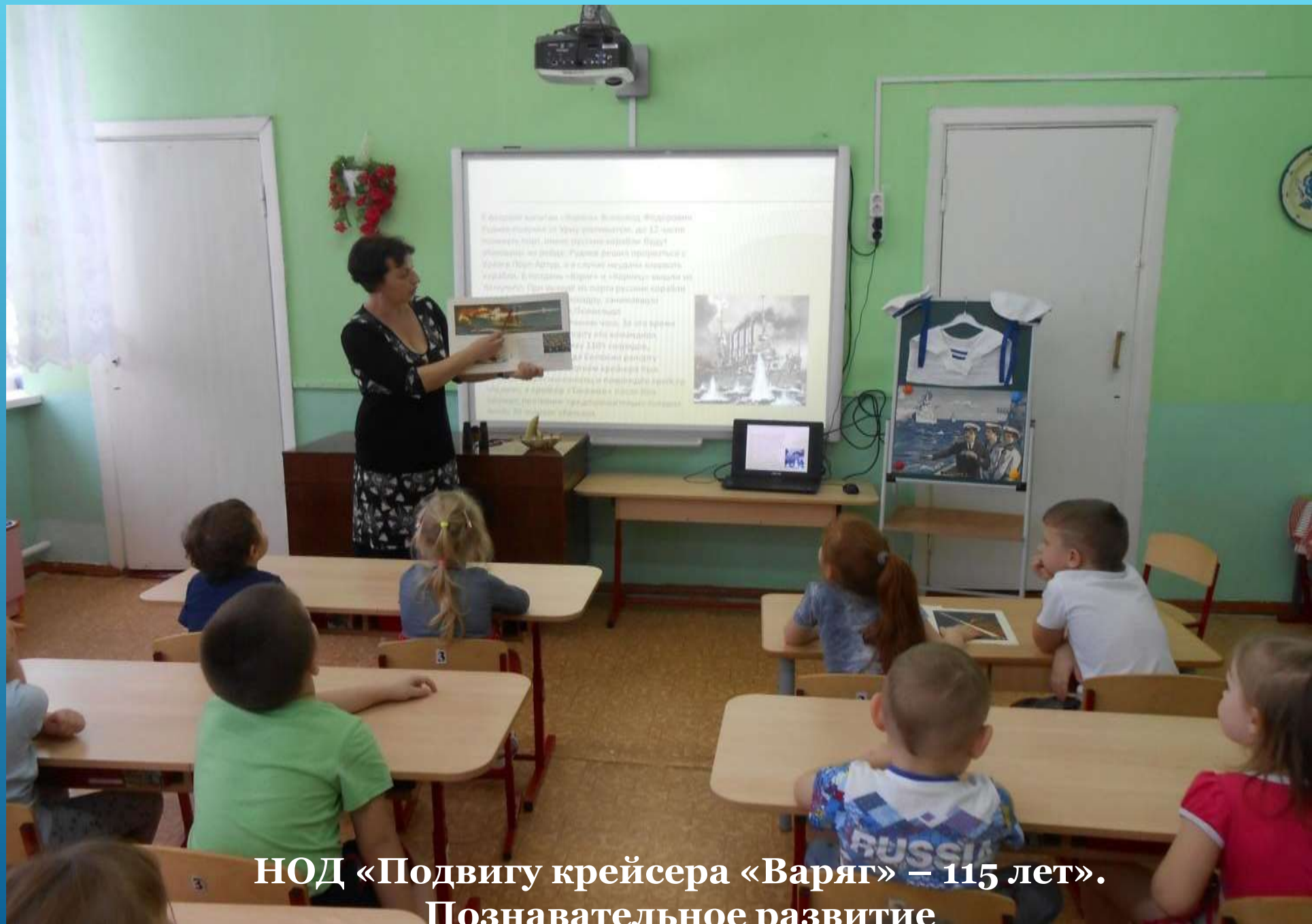
НОД «Подвигу крейсера «Варяг» – 115 лет». Познавательное развитие