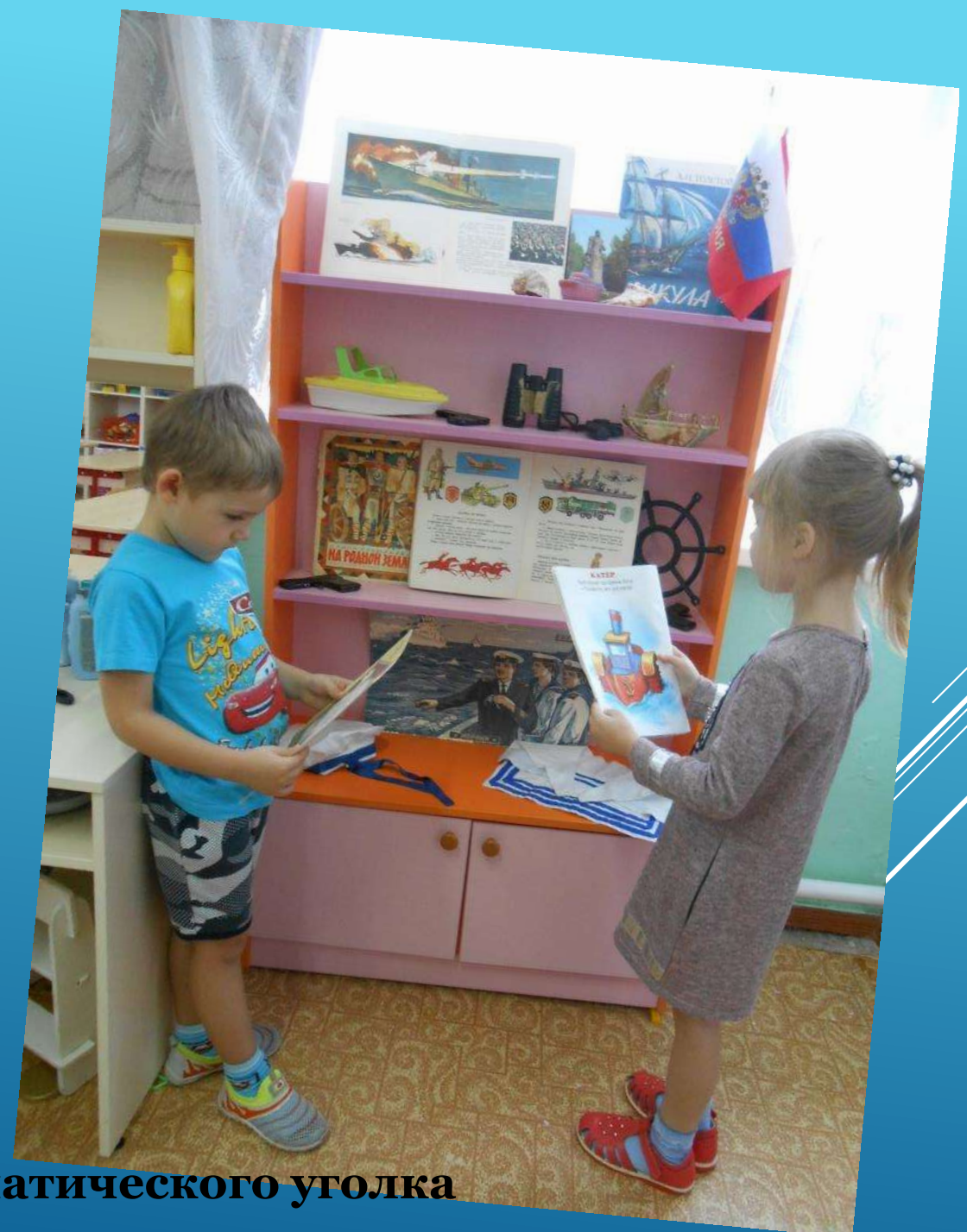
Оформление тематического уголка